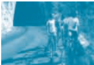
Gorges de la Méouge