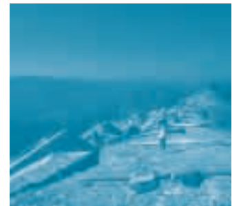
Site international de vol libre Laragne-Chabre

MTA Aviation, atelier de maintenance aéronautique - Possibilité hébergement planeurs ou avions.