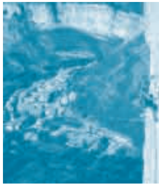
Orpierre : village de l'escalade

7 falaises distinctes accessibles à pied depuis le village 480 longueurs équipées, du 3 au 8C nombreux secteurs faciles